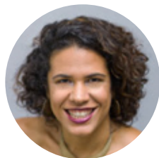
Mediação: Julia Vidal

A Moda é uma forma de expressão identitária e cultural. A identidade brasileira se fez em meio à exclusão de identidades como a negra e a indígena. A moda contemporânea pode ser um gesto de resistência e reparação, valorizando práticas e saberes africanos e indígenas.